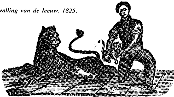
67. De bevalling van de leeuw, 1825.

* In totaal schijnt er op de Amsterdamse kermis in de 19e eeuw slechts viermaal een levende rhinoceros te zien geweest te zijn; waarschijnlijk gaat het om twee exemplaren, misschien zelfs maar om één.