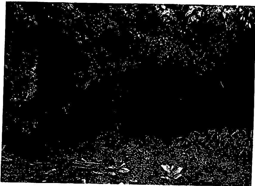
Fig. 4. Westelijke ingang tot de Nglirip grot (Bodjonegoro).