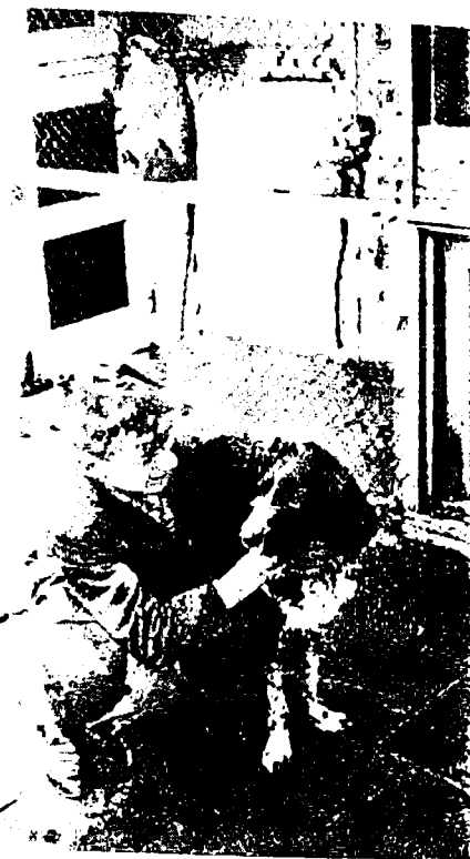
IN DE DIERENTUIN DE BRINK

mogen vertellen. Voor onze jongens is het zorgen van dieren iets geweldigs en ze do met plezier. We weten uit ervaring dat jongens hier veel van leren. Als we oud-jonges spreken, die niet meer in het huis zijn, is het prettig om te horen dat ze nu thuis of op kamer vogels of andere beesten houden. Zouden er nooit aan zijn begonnen als Blij-