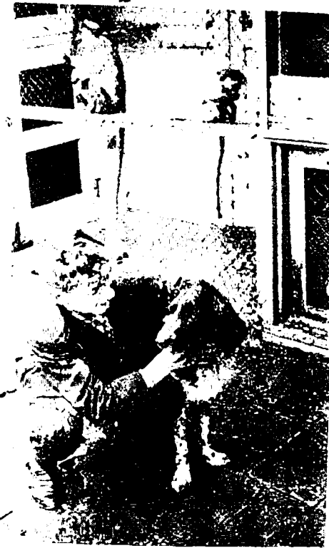
IN DE DIERENTUIN DE BRINK

mogen vertellen. Voor onze jongens is het verzorgen van dieren iets geweldigs en ze doen het met plezier. We weten uit ervaring dat jongens hier veel van leren. Als we oud-jonges spreken, die niet meer in het huis zijn, is het prettig om te horen dat ze nu thuis of op hun kamer vogels of andere beesten houden. We zouden er nooit aan zijn begonnen als Blijdorp