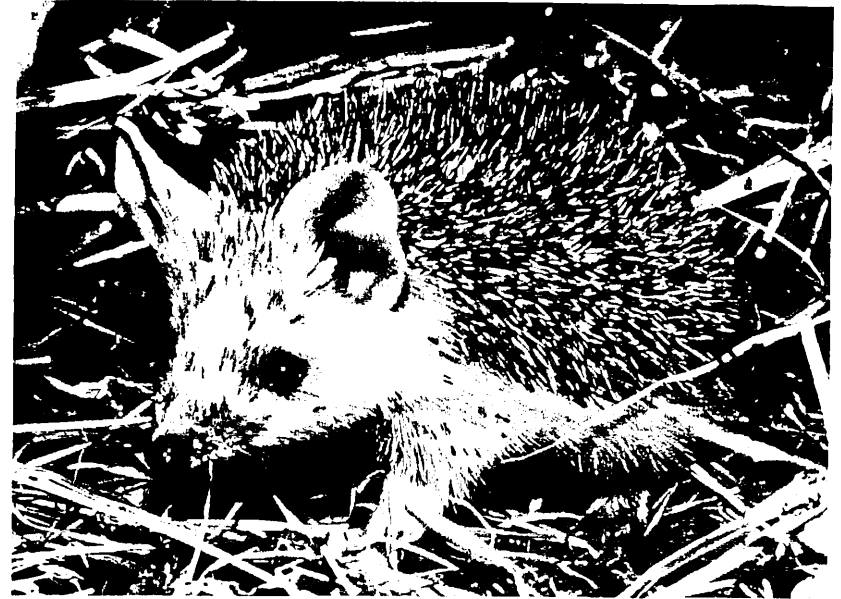
Neuzugang aus dem Zoo St. Petersburg: Langohrigel ( Hemiechinus auritus ).

7 Jungtiere gab es in der Kolonie der Indischen Riesenflugföchse ( Pteropus giganteus ) in der Tropenhalle unseres Alfred-Brehm-Hauses. Die jungen Flugföchse kamen im Mai, Juni, Juli, September und November zur Welt; 6 von ihnen konnten aufgezogen werden. 3 alte Männchen starben, und am Jahresende bevölkerten 30 Riesenflugföchse die Tropenhalle. Bei den Afrikanischen Palmenflughunden ( Eidolon helvum ) kamen 2,1 Jungtiere hinzu; geboren im Januar, März und April. Dies ließ die Gruppe auf 19 Tiere anwachsen. Und einen ersten Nachwuchs gab es bei den Kurznasenflughunden ( Cynopterus sphinx ), allerdings war das Jungtier vom März eine Fehlgeburt.