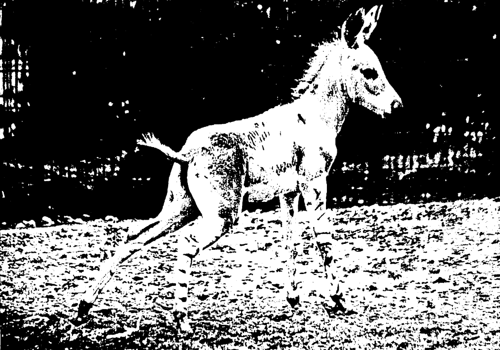
Wertvoller Einhufer-Nachwuchs 1997: Fohlen bei Somaliwildesel ( Equus africanus somalicus ) und Grevy-Zebra ( Equus grevyi ).