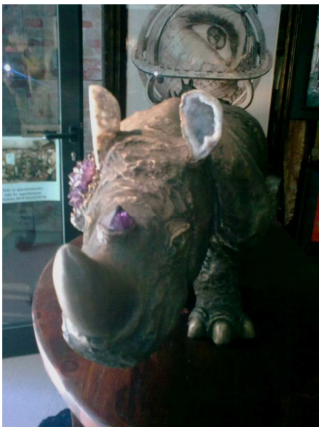
rhinos et coquillages