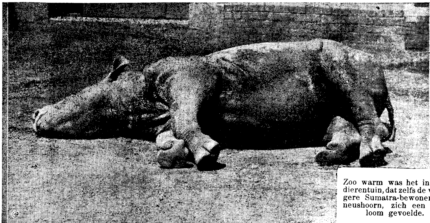
Zoo warm was het in den dierentuin, dat zelfs de vroegere Sumatra-bewoner, de neushoorn, zich een tijdje loom gevoelde.

Op zoo'n film wordt dus een vergroot beeld geprojecteerd van dien looden staaf. Uit de elementaire meetkunde is bekend, dat de verhouding van de lengten van de looden staaf en het beeld op de film, gelijk is aan die van de afstanden van het uittredingspunt der stralen tot de looden staaf en tot de film. Waar nu de afstand van het uittredingspunt der stralen tot de staaf bekend is en ook de dikte hiervan, alsmede de afstand van de film tot den binnenkant van den scheepswand, is op zeer eenvoudige manier de dikte van den scheepswand uit te rekenen en wel met groote nauwkeurigheid. Men kan nu alles zoo inrichten, dat op eenzelfde film een groot aantal foto's opgenomen kan worden, zoodat snel een groot aantal metingen gedaan en dikten gecontroleerd kunnen worden. Deze methode is én door den korten tijdsduur én door het wegvallen van het uitboren, meten en dichtklinken, aanmerkelijk goedkoper.