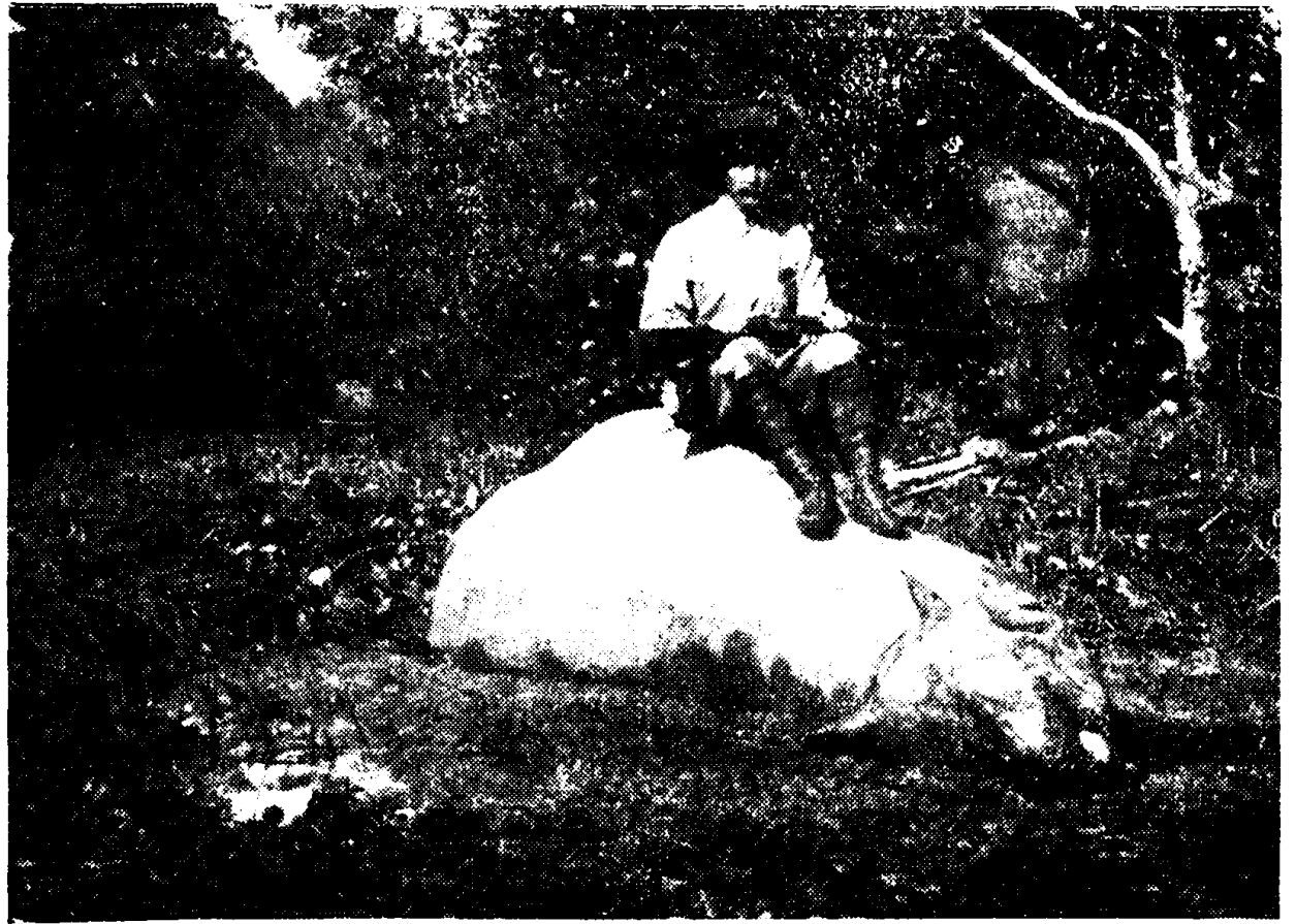
Dertig jaar geleden, toen het in Oedjoeng Koelon nog wemelde van neushoorns. Sedert dien zijn er heel wat van de thans nog sporadisch voorkomende badaks gestroopt.

Tot driemaal toe zag de heer H. neushoorns op zijn weg, eenmaal in een modderbad, waaruit het dier werd opgejaagd en wegliep. Doch toen de heer H. bezig was