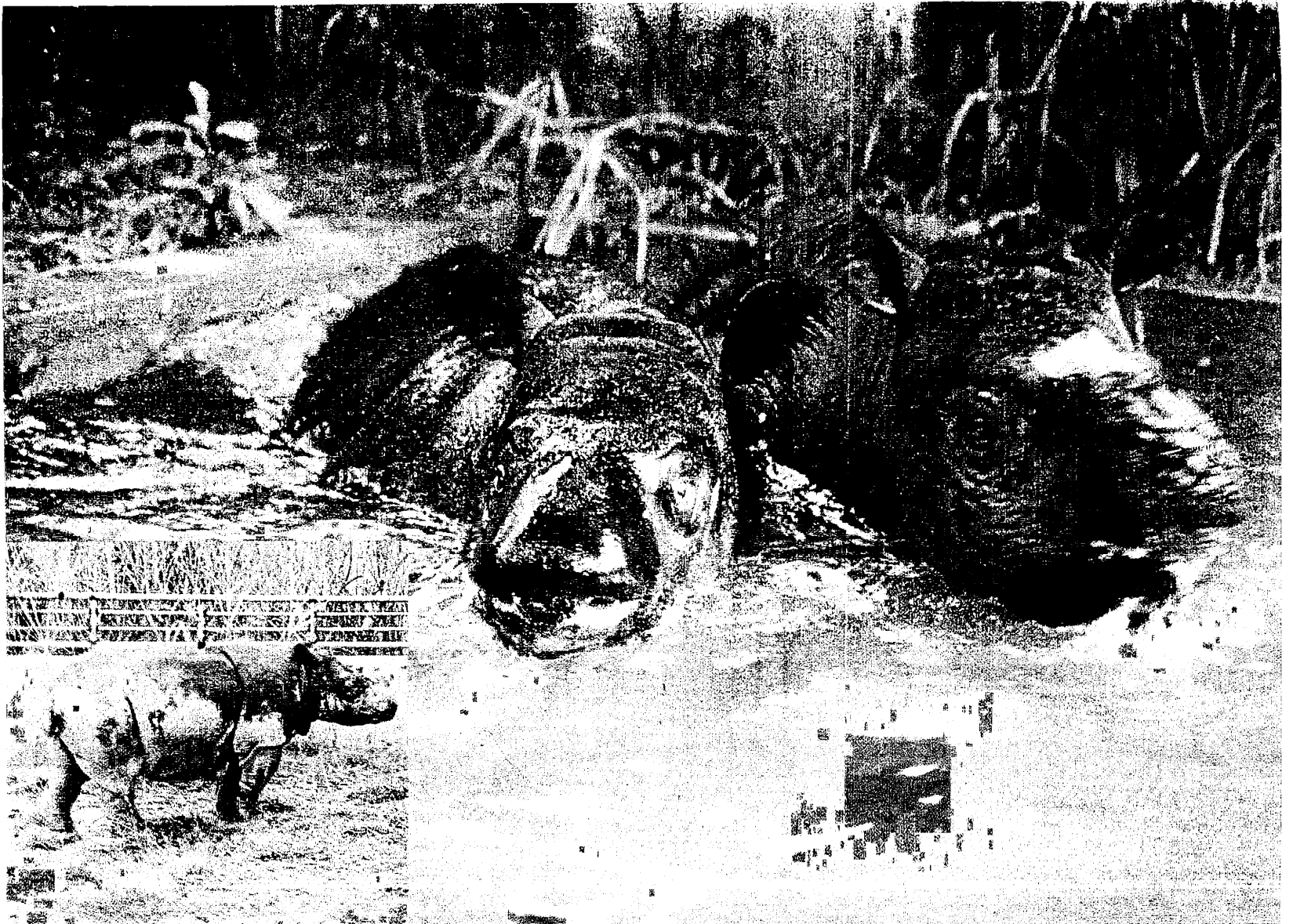
Gambar 10 : Badak Kerbau