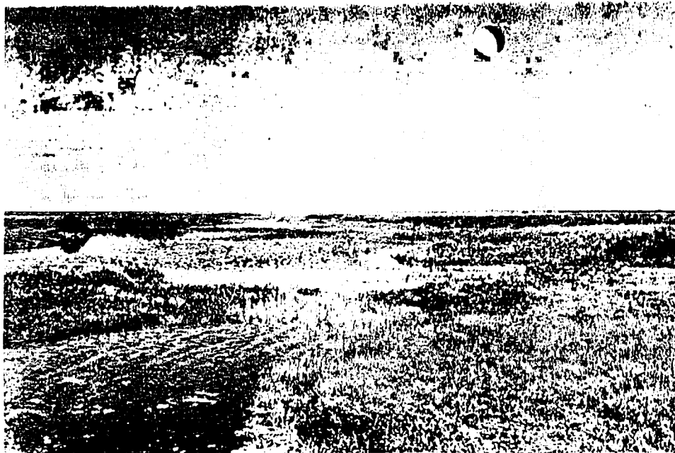
Marismas de Hinojos

bare moeras- en watergebieden voort te zetten.