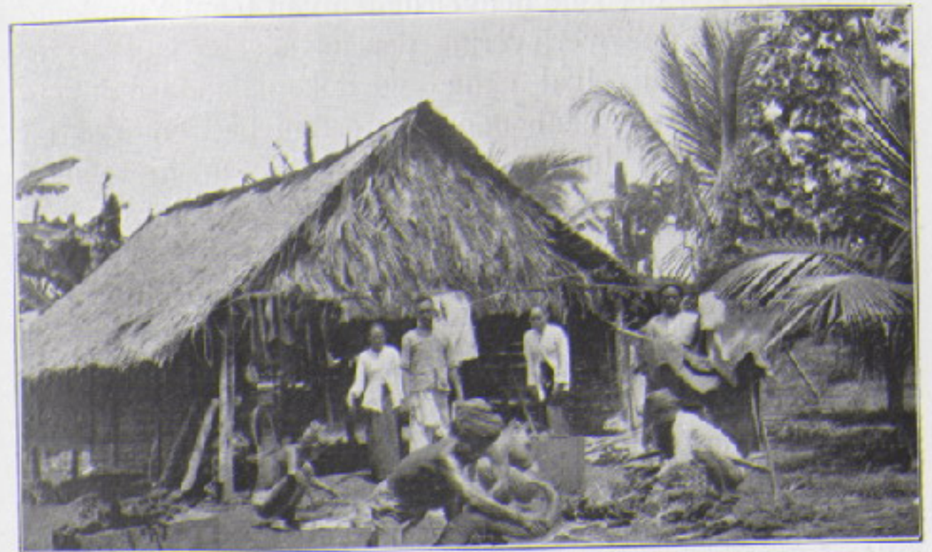
Onze keuken te Tjekapoeh.

Des avonds bevond ik mij reeds op den terugweg, toen Pa Sdi, mijn spoorzoeker, voor zich uit wees en plat op den grond ging liggen; ik deed hetzelfde, en tegelijk zagen wij in de schemering, op 100 meter, drie bantengs uit het bosch te voorschijn treden en den steilen tegalrand beklimmen. De derde was donkerder dan de beide andere, en moest dus een stier zijn. Ik schoot, doch hield iets te veel voor, en legde het dier op de plaats neer door het