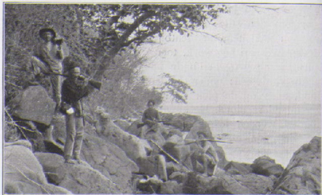
Op weg naar Karambangan.

vrij schot te laten; inmiddels baande zich de stier een weg naar ons toe, maar voordat hij over den greppel was kon ik hem neerleggen. Dat bij zulke gelegenheden de slecht of niet gewapende inlanders handig zijn in het zich uit de voeten maken, is begrijpelijk, en ik kon mijne bewondering over hunne vlugheid niet verzwijgen, toen ik na mijn schot nog slechts een paar kleedingstukken op den grond zag liggen, doch mijne