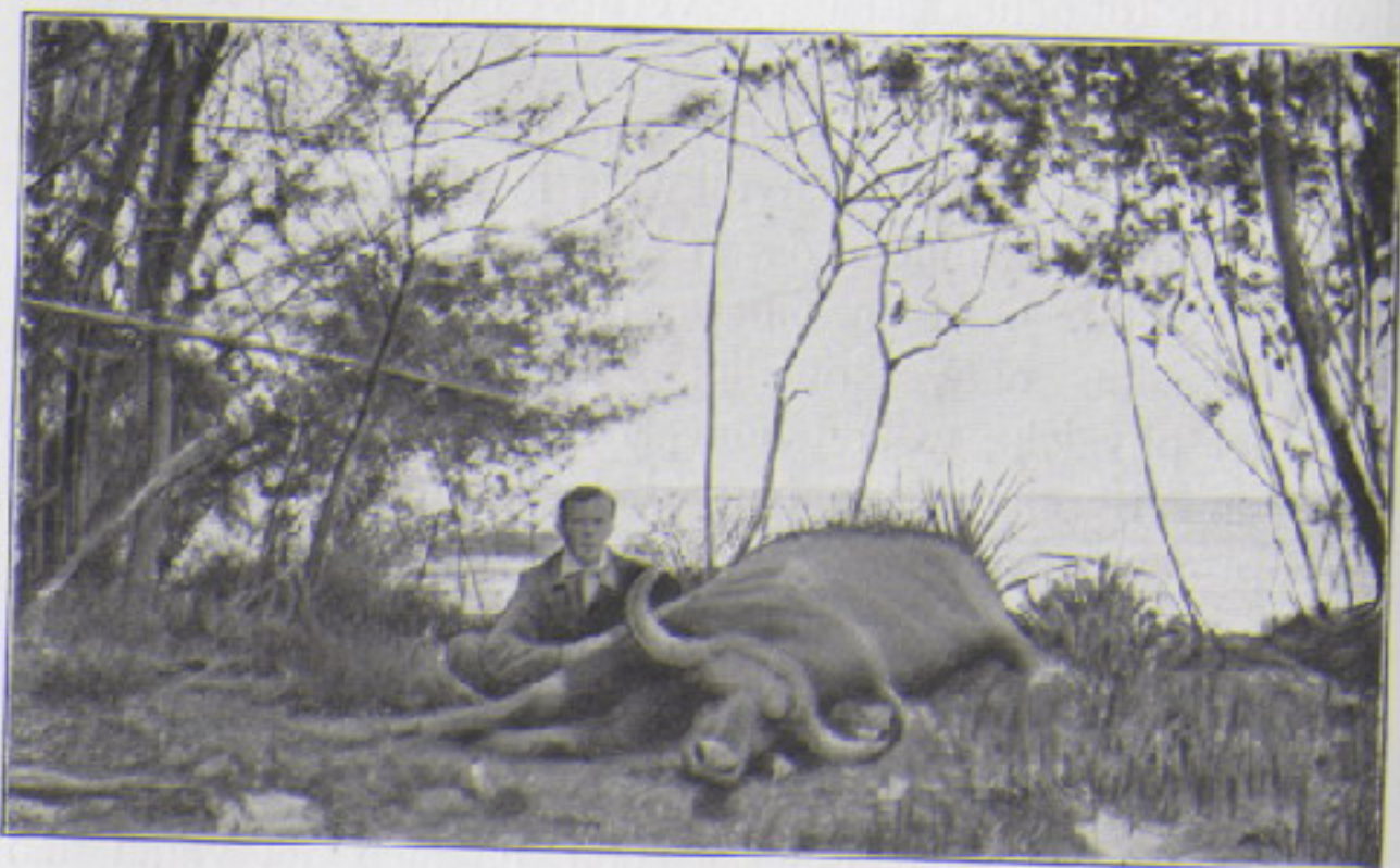
„massieve gele horens“ (blz. 387).

een ontwijken schier onmogelijk is, daar wordt bij een plotselingen aanval van het woeste beest de toestand hachelijk en is dan het oogenblik gekomen, om met koelbloedigheid en vaste hand een doodelijk schot op het hoofd, den hals of het hart te richten. In zulke omstandigheden doodde Boreel eens een rhinoceros met het tweede schot, dat naast den hoorn binnendrong. Het eerste was door de linkerlong gegaan, doch had het beest niet