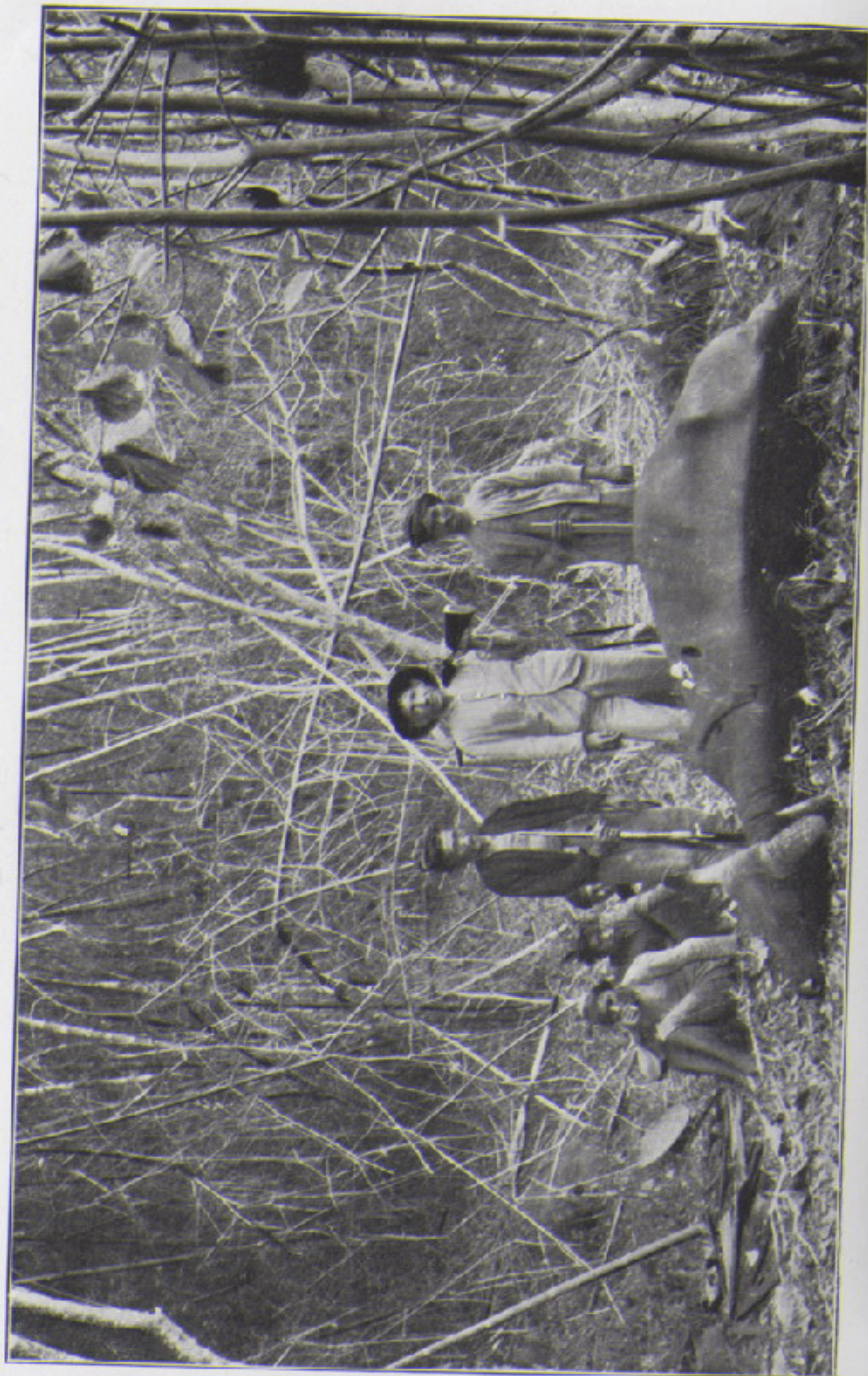
Mijn derde baateng.

hart riep Olif uit: „God in den Hemel zij gedankt”, en wij hielden vroolijk en blij eene lange bespreking van het gebeurde. De zenuwachtigheid was echter bij de inlanders nog niet geheel geweken, en openbaarde zich daarin, dat zij het geval, hetwelk in hunne verbeelding steeds grootere dimensiën aannam, allen tegelijk herdachten, zoodat geen van hen de anderen kon verstaan. Nog vele dagen later hoorden wij, van uit het jachthuis, onze jongens in de keuken de tot eene heldensage verheven episode beschrijven.